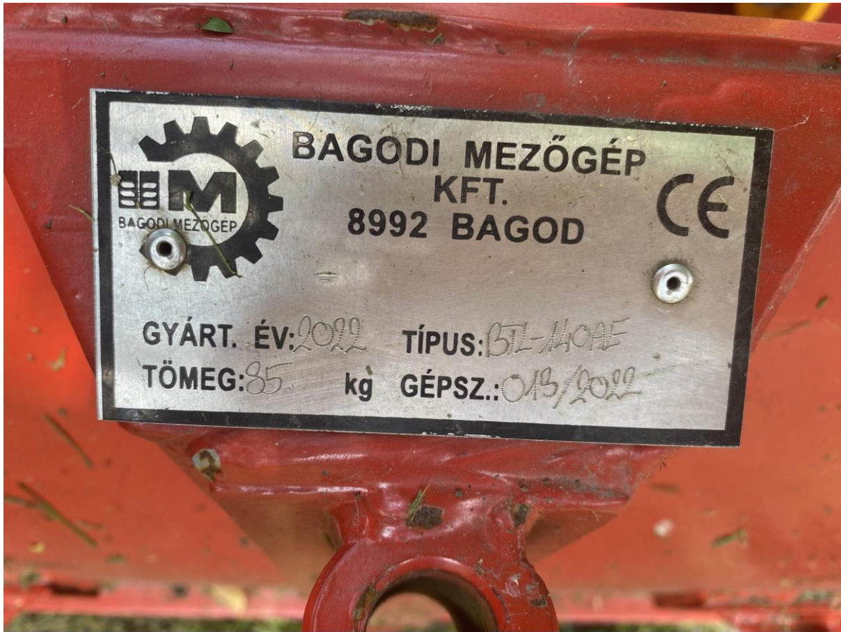
22., BTL 140 AE tolólap: