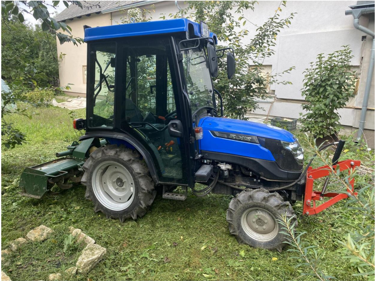
16., SOLIS 26 traktor kabinnal: