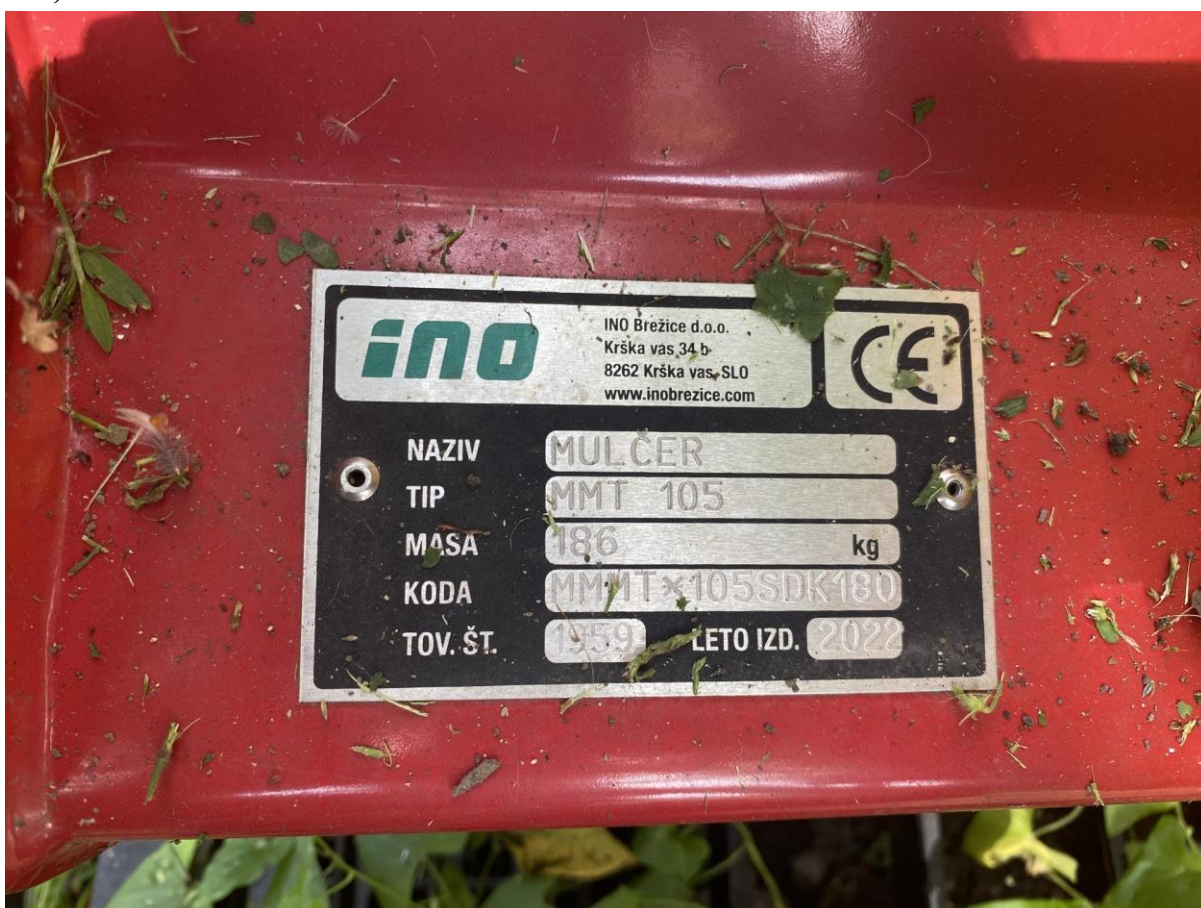
13., INO MMT 105 szárzúzó: