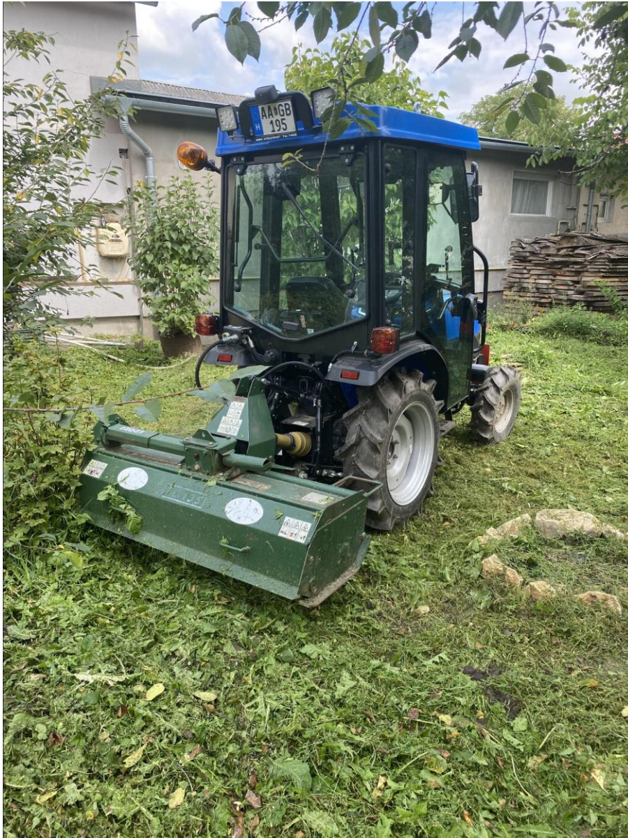
18., SOLIS 26 traktor kabinnal: