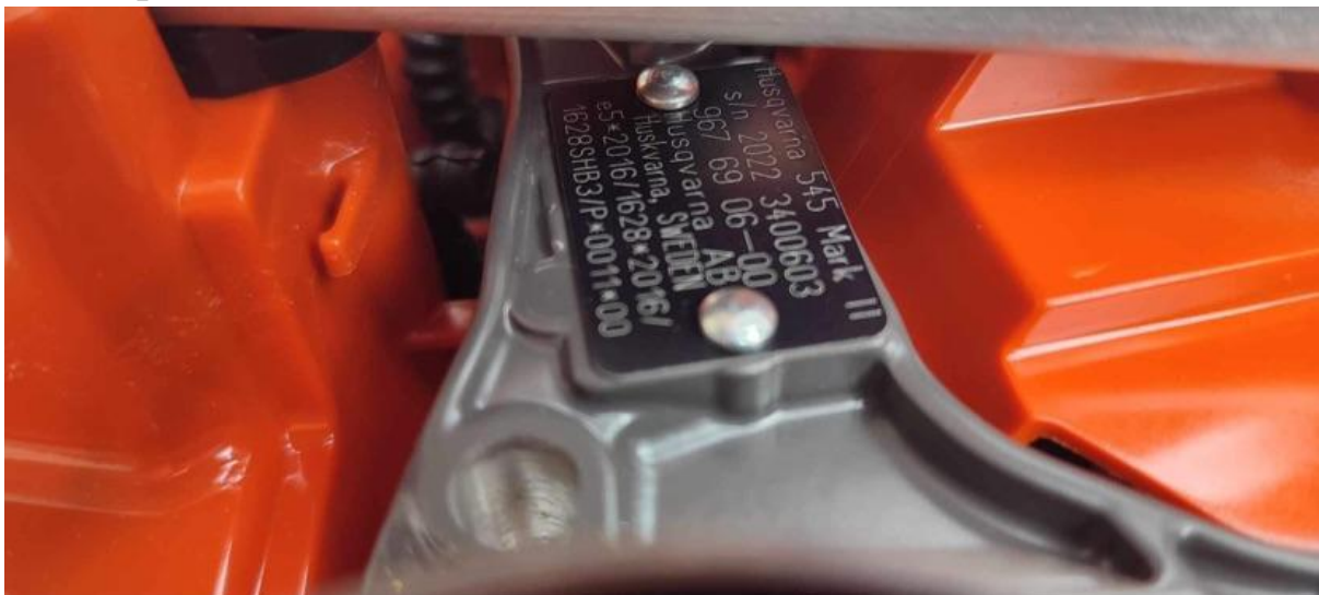
3., Husqvarna 545 Mark II motorfűrész: