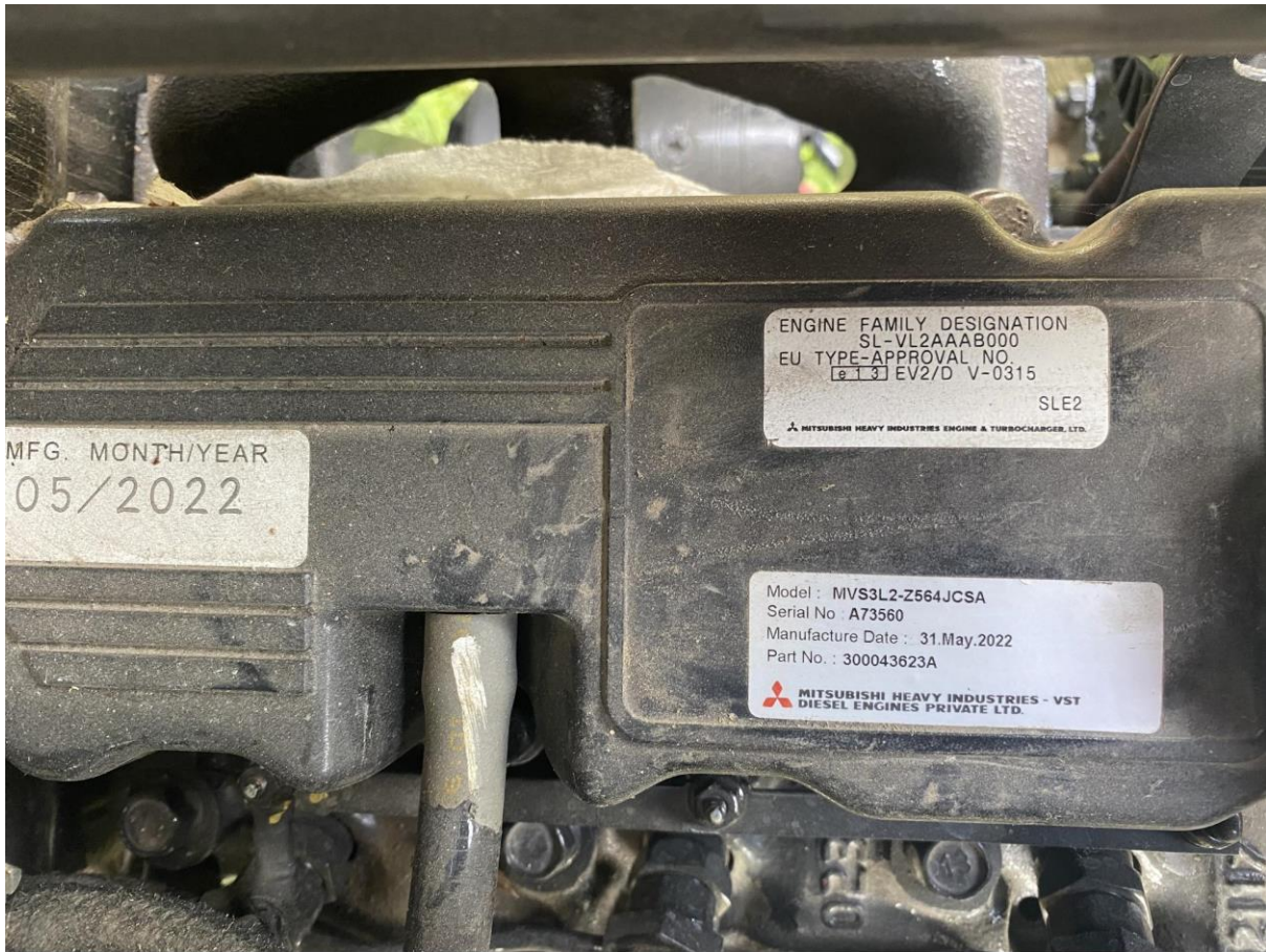
20., SOLIS 26 traktor kabinnal: