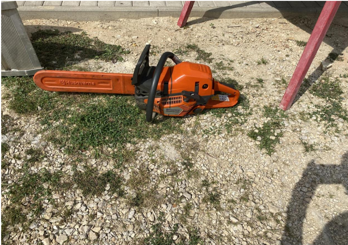
2., Husqvarna 545 Mark II motorfűrész: