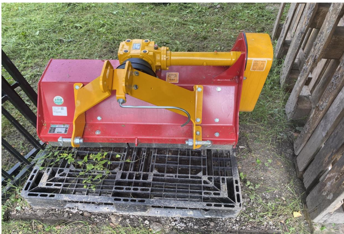
14., INO MMT 105 sz r z :