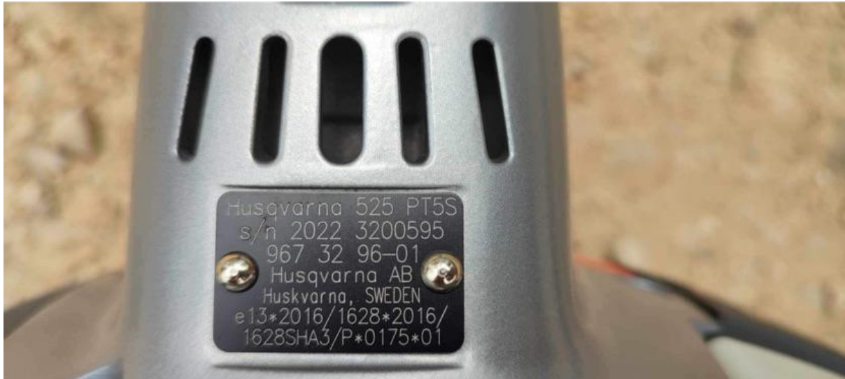
8., Husqvarna 525 PT5S magassági ágvágó: