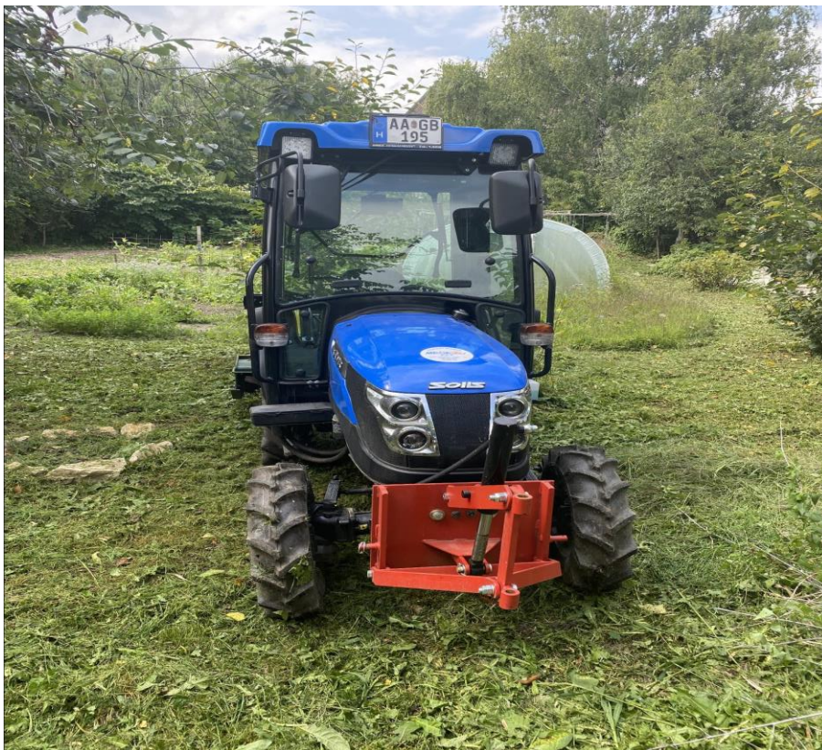
17., SOLIS 26 traktor kabinnal: