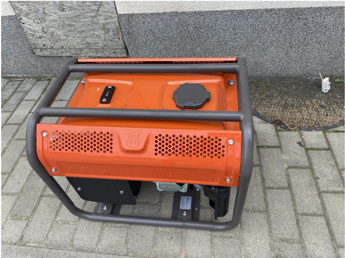
11., Husqvarna G3200P aggregátor: