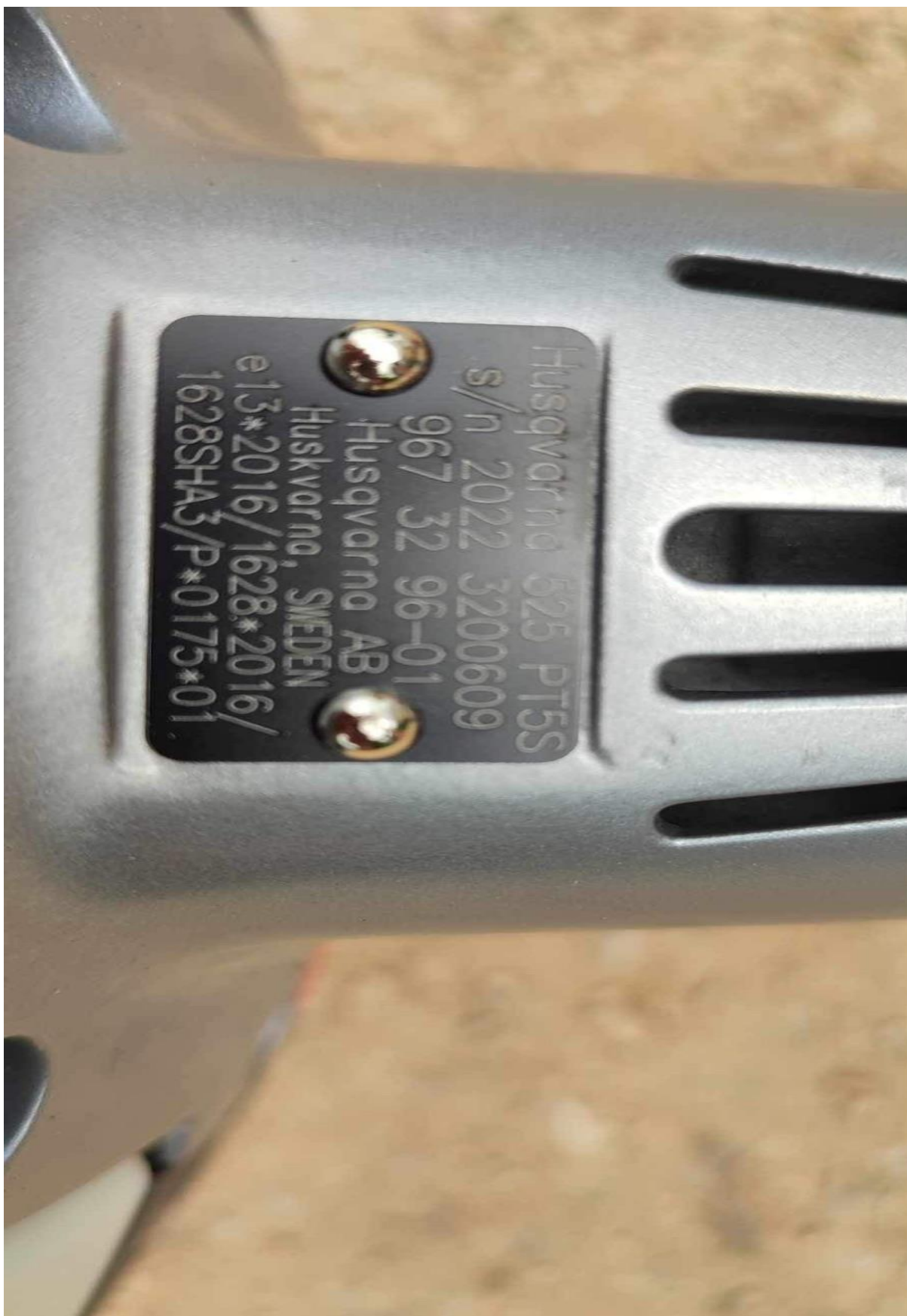
7., Husqvarna 525 PT5S magassági ágvágó: