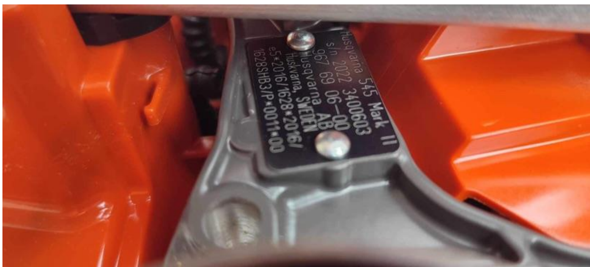
4., Husqvarna 545 Mark II motorfűrész: