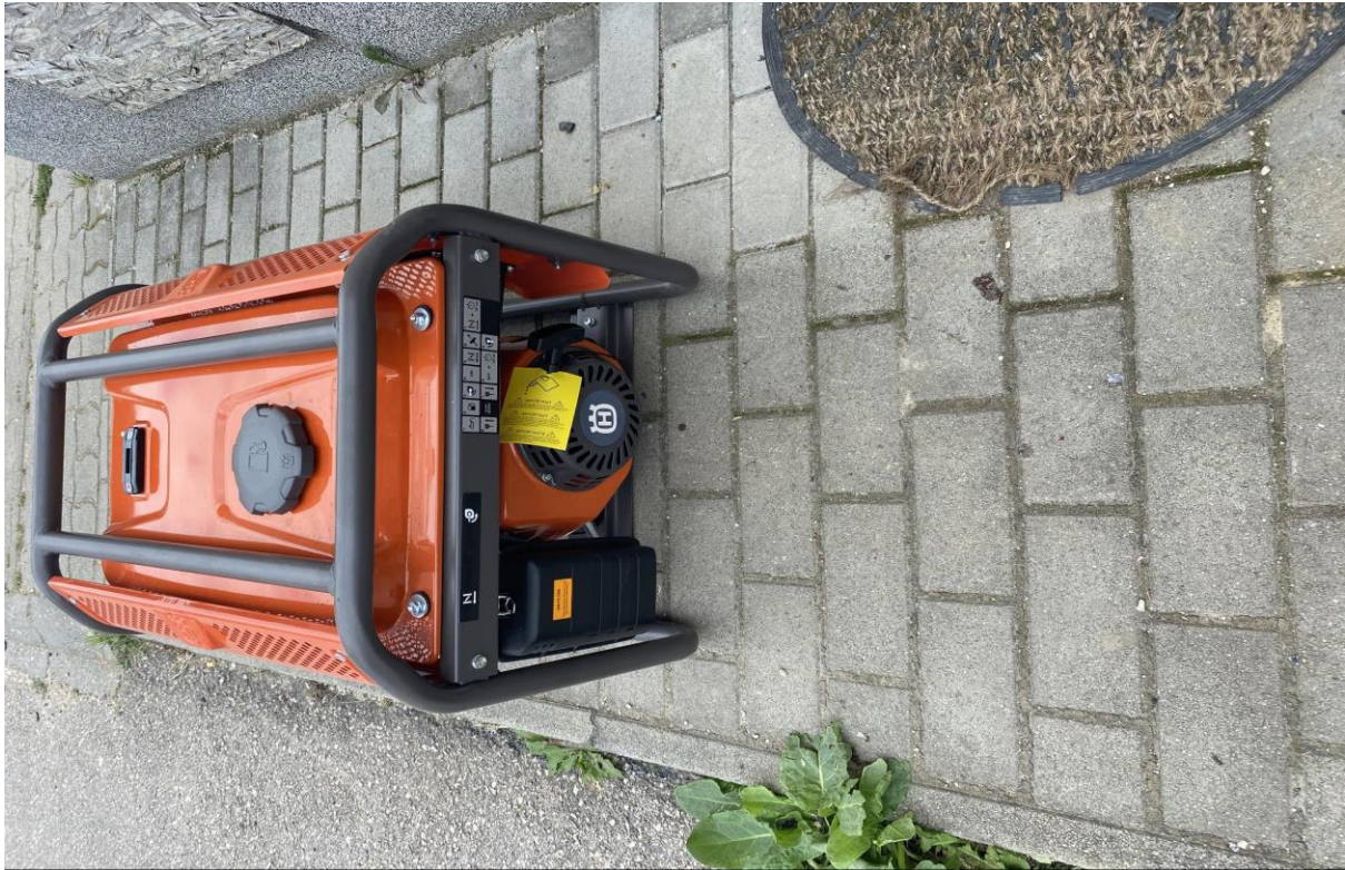
10., Husqvarna G3200P aggregátor: