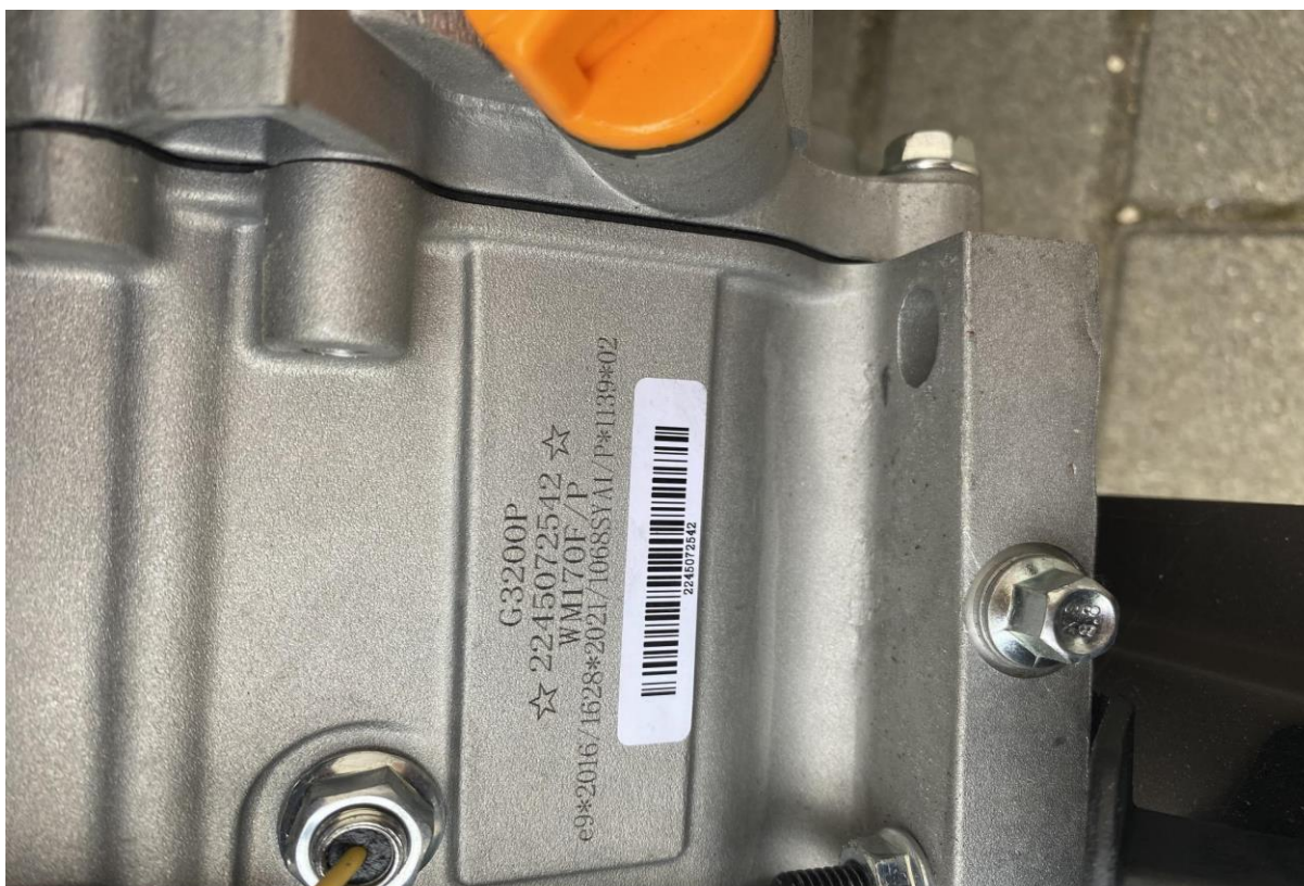
12., INO MMT 105 szárzúzó: