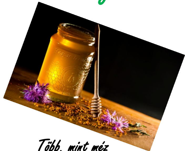
Több, mint méz