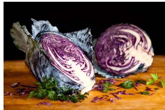
Több, mint zöldség