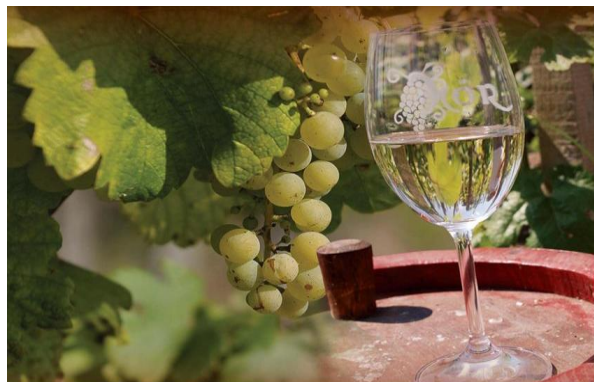
Több, mint bor