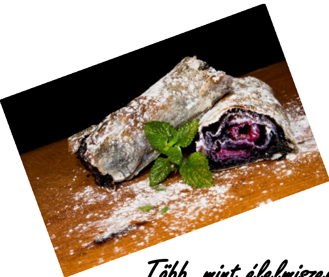
Több, mint élelmiszer